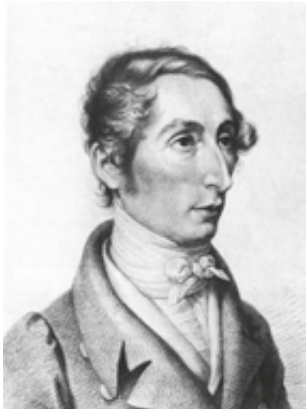
Der junge Komponist Carl Maria von Weber, Stich von C. A. Schwerdgeburth nach einem Gemälde von Carl Christian Vogel, 1823