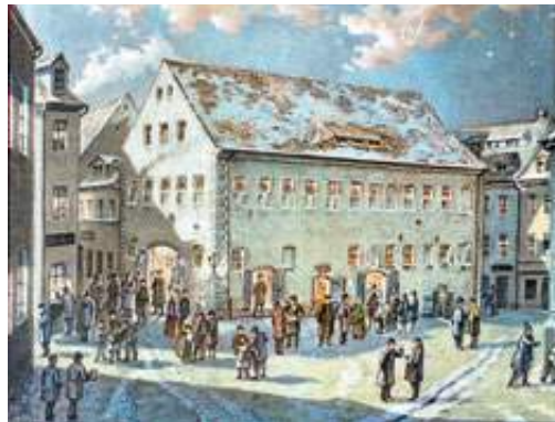
Das Freiburger Theater zur Zeit von Webers Uraufführung