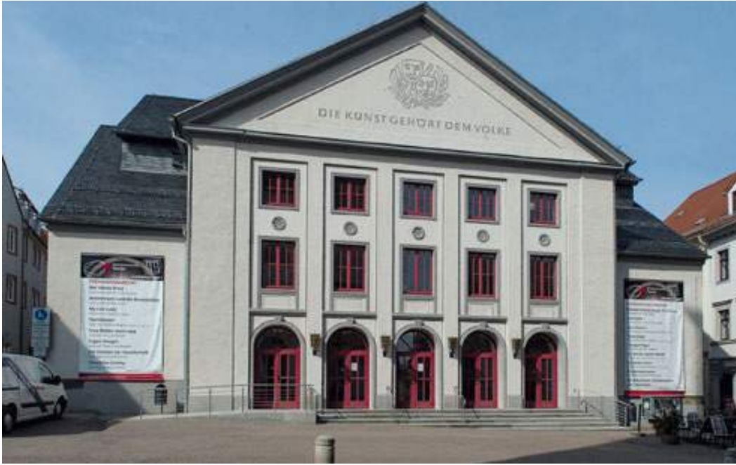
Das Theater Freiberg, 2010

ließ es zum Theater umbauen, ein Jahr später erwarb es die Stadt Freiberg für 1900 Taler. Der 14-jährige Carl Maria von Weber (1786–1826), der sich zusammen mit seinem Vater für mehrere Monate von November 1800 bis März 1801 in Freiberg aufhielt und im Gasthaus „Goldener Löwe“ auf der Erbsichen Straße 3 wohnte, komponierte dort seine zweite Oper „Das Waldmädchen“ in zwei Akten, die am 24. November 1800 hier uraufgeführt wurde.