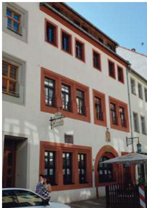
Das Gasthaus „Goldener Löwe“