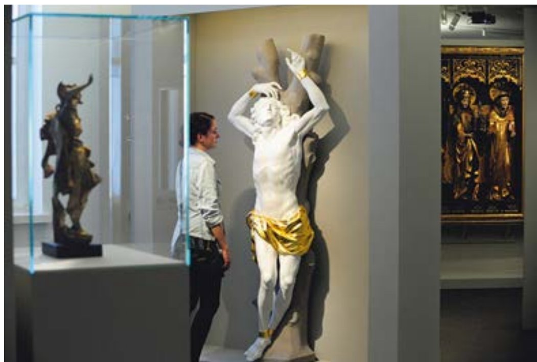
Ausstellungsraum der 3. Sächsischen Landesausstellung „Via regia – 800 Jahre Bewegung und Begegnung“ 2011 in Görlitz