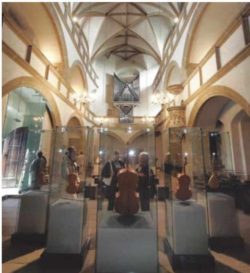
Die Torgauer Schlosskapelle als Teil der 2. Sächsischen Landesausstellung „Glaube und Macht“ 2004

Die Planung solcher Vorhaben war ohne den hohen Fachverstand der Mitarbeiter des Landesamts für Denkmalpflege, das dem SMWK zugeordnet war, nicht vorstellbar. Ob Wiederaufbaukonzeption der Frauenkirche, zu der der Freistaat auch einen Beitrag leistete, ob Schlosskonzeption, ob Antrag Weltkulturerbe Dresd-