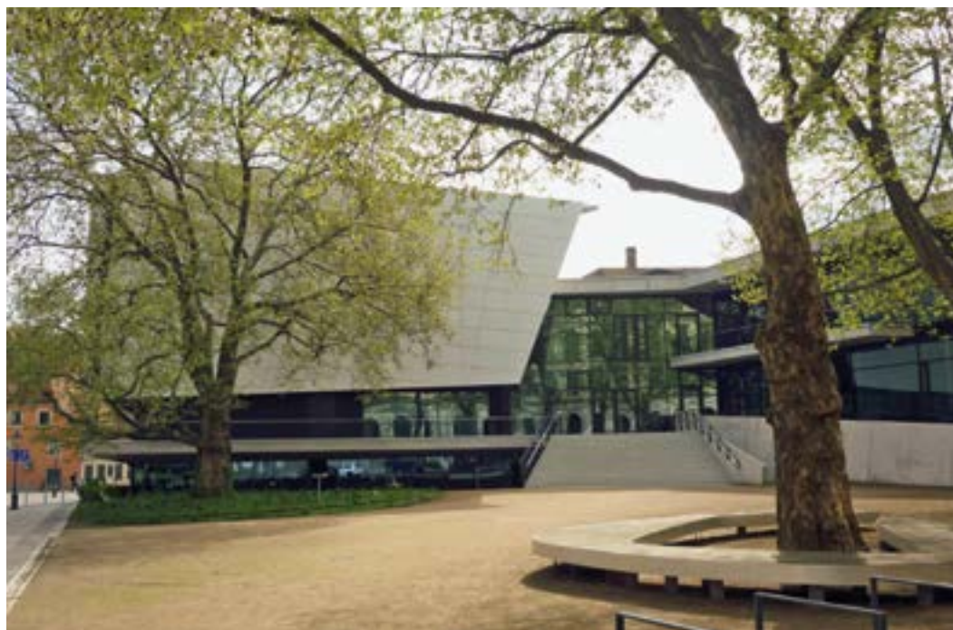
Konzertsaal der Hochschule für Musik in Dresden

Viel problematischer waren die Sanierungsarbeiten für die Staatlichen Kunstsammlungen Dresden und die anderen staatlichen Museen in Leipzig, Görlitz und Herrnhut. Das Finanzministerium war äußerst zurückhaltend bei der Finanzierung von Gebäuden, die zum Teil noch aus dem 19. Jahrhundert stammen. Lediglich der Semberbau der Galerie Alter Meister, den die Museumsmitarbeiter 1989 mit Rückendeckung der UNESCO hatten schließen lassen, um die DDR-Behörden zu dringend notwendi-