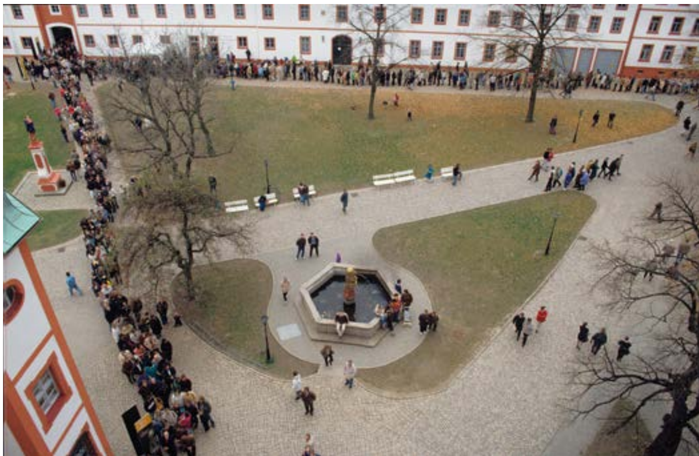
Lange Schlangen bei der 1. Sächsischen Landesausstellung „Zeit und Ewigkeit“ in St. Marienstern