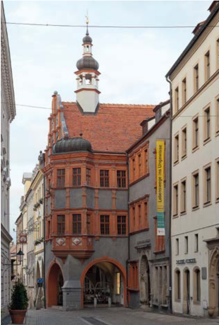
Der Schönhof in Görlitz, heute Schlesisches Museum

zerstörten baulichen Erbe nicht rekonstruiert worden oder neu entstanden. Dank kollegialer Verbindung zum Referat Denkmalschutz im Innenministerium konnte auch ein vorbildliches sächsisches Denkmalschutzgesetz entstehen.