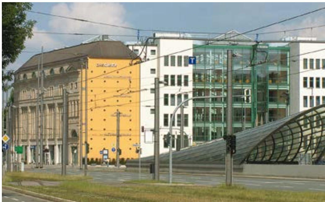
Kulturkaufhaus DAS Tietz in Chemnitz