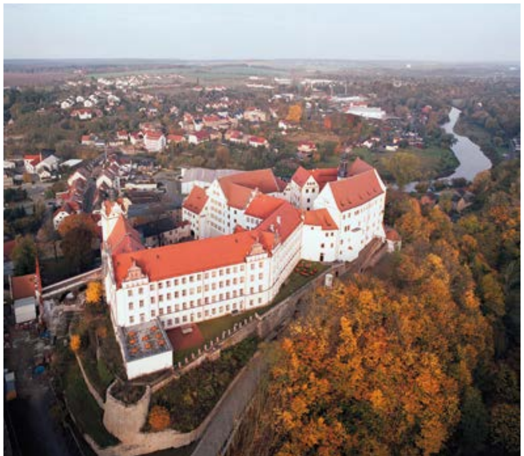
Schloss Colditz, heute Sitz der Landesmusikakademie des Freistaats Sachsen

Im Germanischen Nationalmuseum in Nürnberg haben der Bund, der mitfinanziert, und je zwei Länder einen Sitz, neben dem Freistaat Bayern und der Stadt Nürnberg. Im Verwaltungsrat, dem Entscheidungsgremium, sind außerdem Vertreter der Bayrischen Staatsmuseen, der beiden Konfessionen, des Hauses Wittelsbach und der Bürgerschaft aus Nürn-