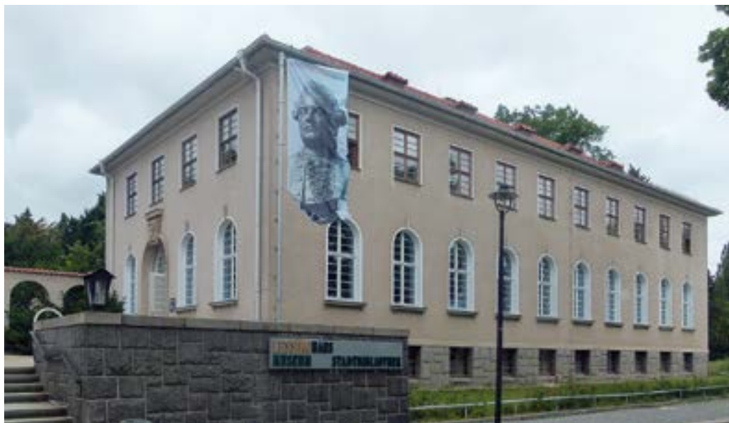
Lessing-Museum in Kamenz

dringliche Aufgabe an, sächsischen Autoren Sendezeit zur Verfügung zu stellen, aber mit Hilfe der Sächsischen Landesmedienanstalt und anderer Fördermaßnahmen konnten viele interessante Streifen entstehen. Für die Kinos war es wichtig, sich durch Anschaffung von Digitaltechnik auf moderne Vorführweisen einzustellen, zumal in dem gesellschaftlichen und ökonomischen Umbruch Kinos in kleineren Gemeinden oft die letzte Kulturstätte waren. Auch hierfür stellte das SMWK Fördermittel bereit. Da bekanntlich in Dresden das Defa-Trickfilmstudio bis 1990 seinen Sitz hatte, bestand die Notwendigkeit, alle Produktionen zu archivieren. Diese Aufgabe übernahm das Deutsche Institut für Animationsfilme (DIAF), dessen Arbeit vom Filmreferat des SMWK unterstützt wurde.