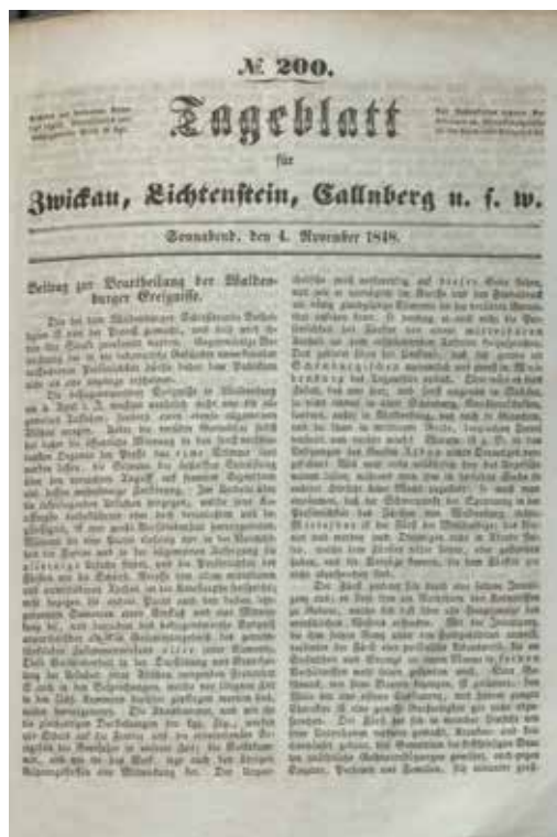
Auswertung der Waldenburger Ereignisse in Tageblatt für Zwickau, Lichtenstein, Callenberg und Umgebung, 4. November 1848 Staatsarchiv Chemnitz, 30593 Herrschaft Waldenburg, Nr. 1270, Blatt 84