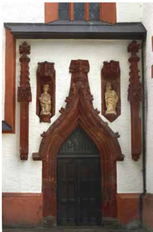
links: Kirche Unser Lieben Frauen in Mittweida, östliches Portal an der Nordseite