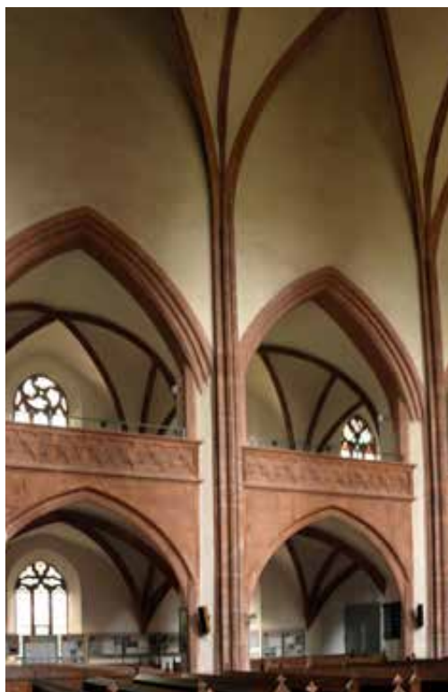
rechts: Kirche Unser Lieben Frauen in Mittweida, Nordschiff mit Arkaden der ursprünglichen Stufenhalle und jüngerer Empore. Die Emporenbrüstung stammt von 1886/87.