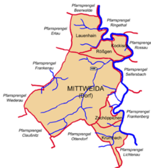
Der Pfarrsprengel Mittweida um 1200

Am Anfang des 14. Jahrhunderts erhielt die Mittweidaer Kirche die Grundherrschaft über zwei Dörfer ihres Pfarrsprengels. Im Jahre 1300 übereignete