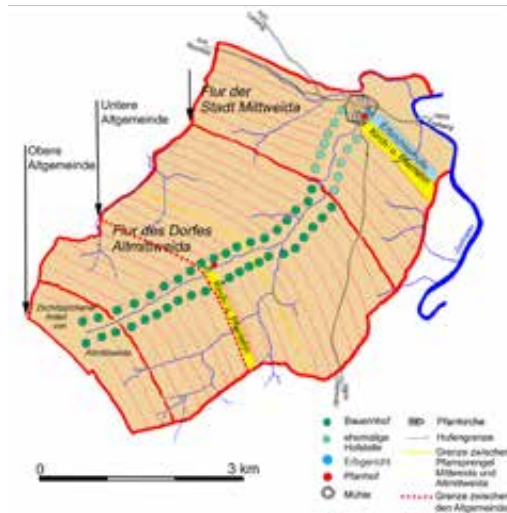
Altmittweida und Mittweida im Spätmittelalter