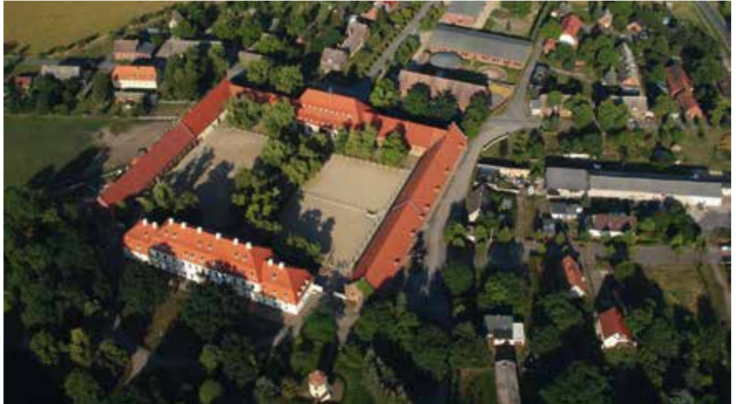
Luftaufnahme des Hauptgestüts Graditz

der Nutzung als „Stutterey“ geschrieben wurde. Kurfürst Friedrich August I. von Sachsen beauftragte den sächsischen Landbaumeister Matthäus Daniel Pöppelmann (1662–1736) mit der Planung und der Bauaufsicht der Graditzer Gestütsanlage, welche von 1721 bis 1726 gebaut wurde. Dem Bau der Stallungen folgte die Errichtung des Herrenhauses, später Landstallmeisterhaus oder Schlossgebäude genannt. Durch Errichtung des Torhauses im Jahr 1800 nach Plänen des Oberlandbaumeisters Christian Traugott Weinlig (1739–1799) wurde der Innenhof geschlossen.