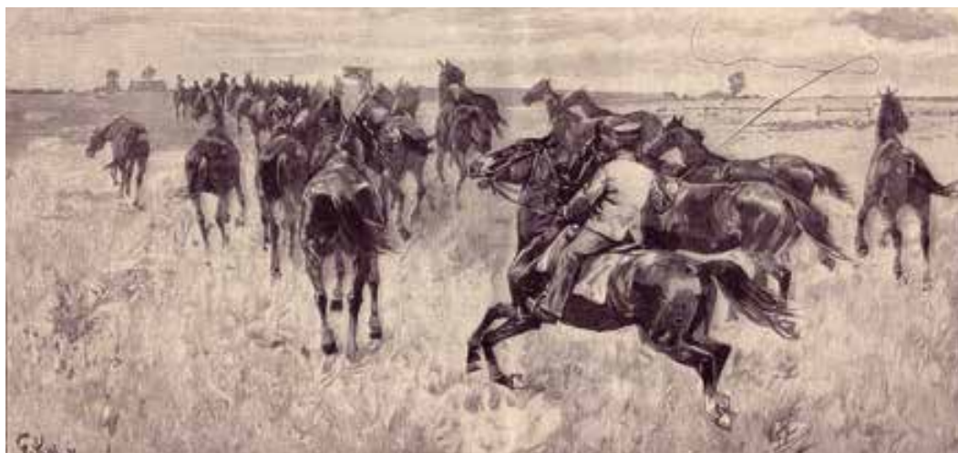
Stutenherde auf der Döhle Flur, Stich, 19. Jahrhundert