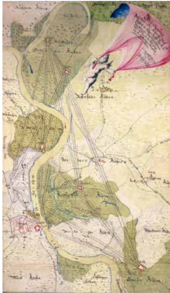
Übersichtsplan der „Torgaischen Gestüte“