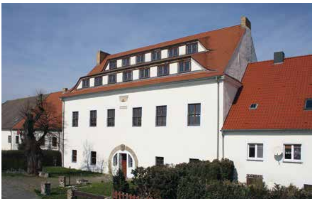
Gestüt Repitz, Hauptgebäude (ehemaliges Torhaus)

eine „Stutterey“ ausgewählt. Das Gutachten legte dar, dass sich das Gelände der Wüsten Mark Repitz als Standort für die Pferdezucht ideal eignet. In Repitz, gelegen am westlichen Ufer der Elbe, wurde am 10. Mai 1686 ein Gestüt gegründet. Zweckbestimmung der Gestütsanlage war die höfische Pferdezucht auf einer Fläche von 234 Hektar, davon 151 Hektar Wiesen und 72 Hektar Ackerland. Die Auswahl des Gestütsgebietes am Stadtrand von Torgau erwies sich als sehr gut, denn 1706 standen dann bereits 80 Mutterstuten in Repitz. Die Angliederung an die „Torgauischen Gestüte“ erfolgte im Jahre 1723. Der Gebäudekomplex, bestehend aus einem monumentalen Innenhof mit Torbogenhaus, wurde 1689 erbaut, was noch heute an der Giebelwand des östlichen Baues zu lesen ist. In der fortschreitenden Entwicklung des sächsischen Gestütswesens begann man mit der Bildung von Landbeschäleinrichtungen in Sachsen, darunter auch in Repitz.